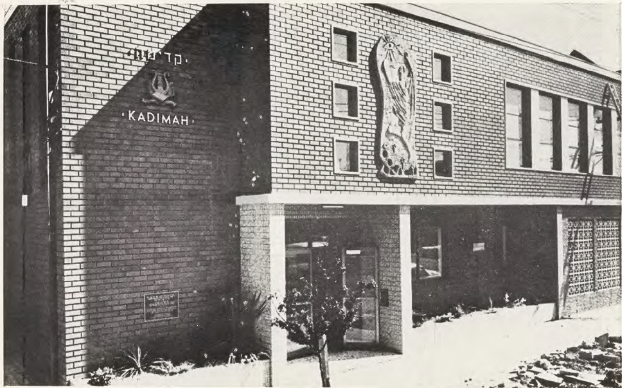
The new "Kadimah" building דער פראנט פון דער נייער "קדימה" געביידע