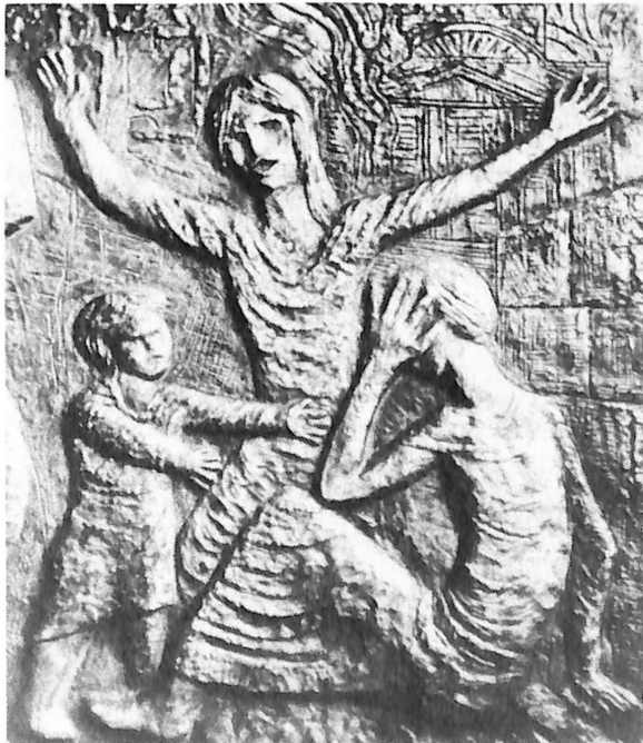
Carlton War Memorial — detail 1962