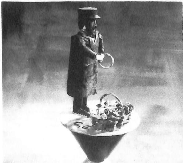
The Bagel Seller